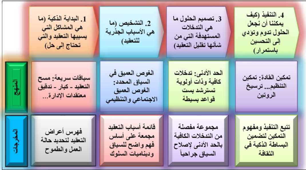
الشكل (2) الخطوات الأربعة لمنهج البساطة الذكية

وأوضح (Backx,at.el.,2017:10) بأن BCG قد وضعت ونشرت مدخل من أربع خطوات للتبسيط الذكي كما في الشكل (2).