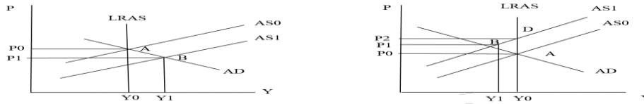
شكل 5 (A) صدمة عرض إيجابي

ثانياً :- صدمة العرض الكلي: تمثل اجمالي السلع والخدمات المنتجة في الاقتصاد والتي يرغب المنتجون بيعها خلال مده زمنية محدد مضافاً اليها الاستيرادات الخارجية من سلع وخدمات ويكون منحنى العرض الكلي عمودياً في الاجل الطويل ويكون منحدرأ في الاجل القصير ومتجهأ نحو الأعلى في الاجل الطويل ويعكس علاقه طرديه بين الاسعار والناتج (باحنشل، 1999:9) وتعرف صدمه العرض بانها احداث تؤثر على تكلفه عوامل الإنتاج وهي نوعان سلبيه وايجابيه، السلبيه لها اثر مباشر وتؤدي الى ارتفاع الاسعار والتكاليف وانخفاض الانتاج مثل الجفاف الذي يحصل للسلع الزراعيه ويؤدي الى ارتفاع اسعارها واسعار السلع المستورده ويوضح الشكل البياني صدمات العرض الكلي الإيجابية والسلبيه.